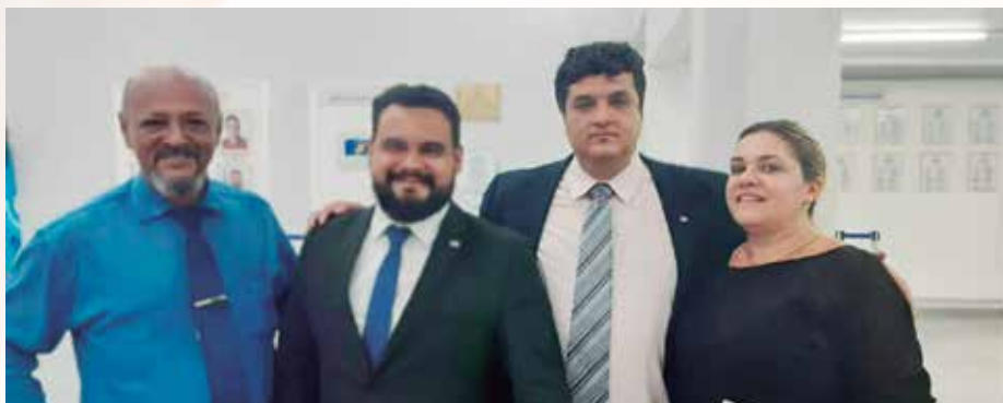
Diretoria da UGOPOCI com advogados da CBU Advogados Associados

Além do acréscimo de 11,98% no contracheque do associado, existe ainda uma diferença a ser paga pelo Estado que diz respeito a data do trânsito em julgado da sentença (início de 2019) e o efetivo cumprimento da ordem judicial, mês que o servidor foi