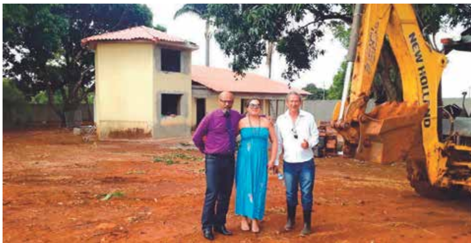
Diretoria da UGOPOCI acompanhando toda a revitalização da Chácara Tio Patinhas