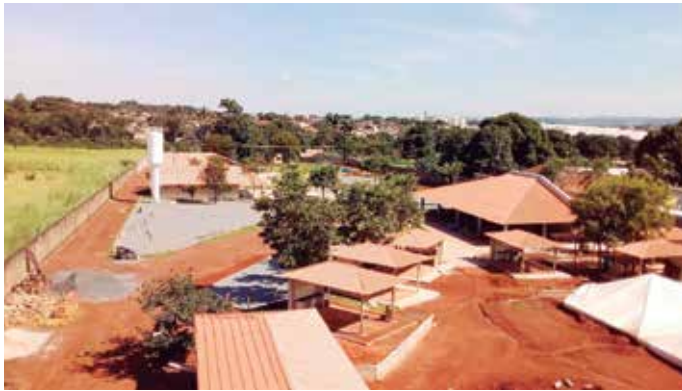
Obras quase finalizadas