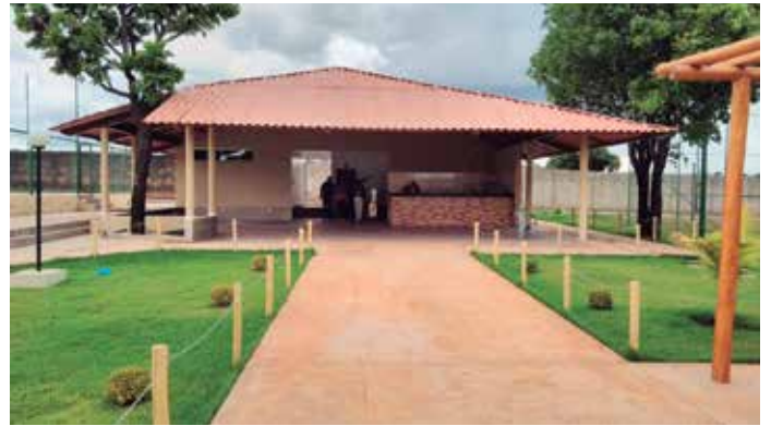
Finalizado as obras do salão gourmet que fica localizado entre as quadras de areia e o campo Society