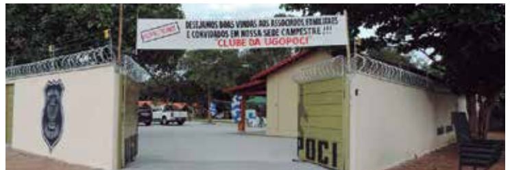
Portão de entrada da sede campestral em Aruanã