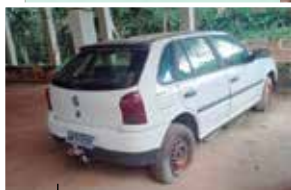
Veículo deixado pela gestão anterior