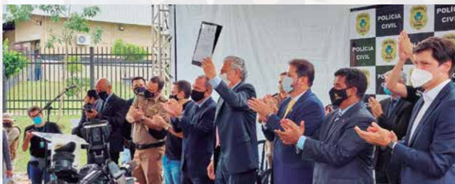
Governador Ronaldo Caiado após assinar a nova Lei