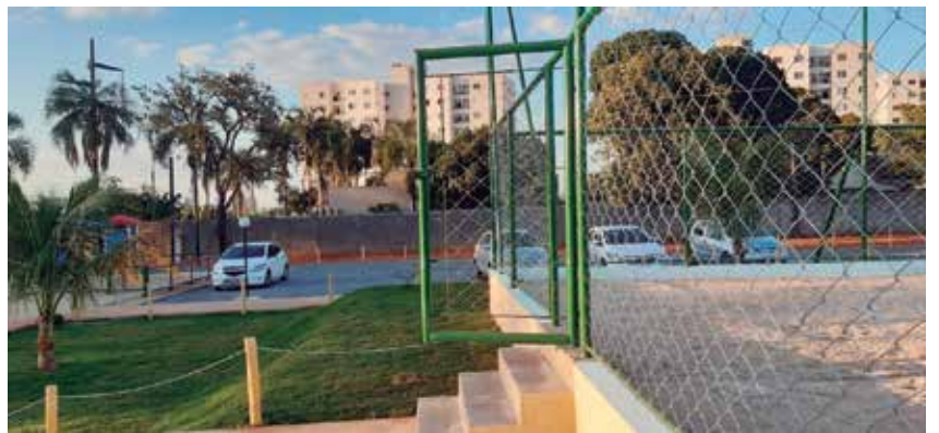
Quadra de areia (direita) e parque infantil (ao fundo, lado esquerdo)