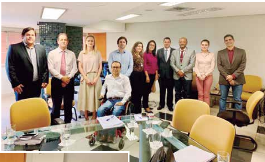
Diretoria da UGOPOCI reúne-se com representantes da GOIÁSPREV

Uma das pautas da reunião, tratou da aposentadoria especial dos policiais civis, principalmente na aplicabilidade da Lei Complementar 59/2006. Discutiu-se também os reflexos da reforma da previdência