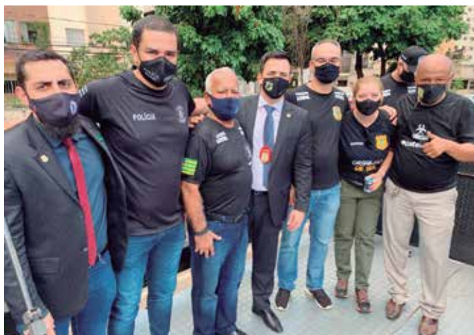
Presidentes das Entidades se reuniram em frente à Alego