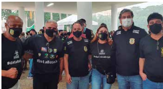
Manifestação em prol da data-base defronte a Assembleia Legislativa de Goiás – ALEGO