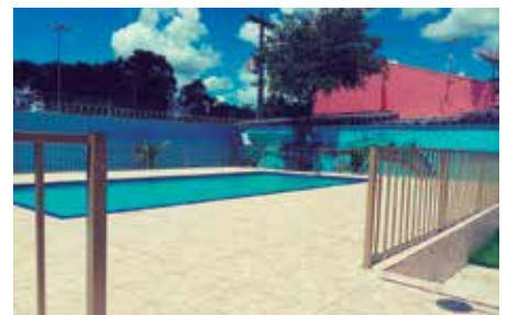
Dois piscinas disponíveis: uma adulta e outra infantil