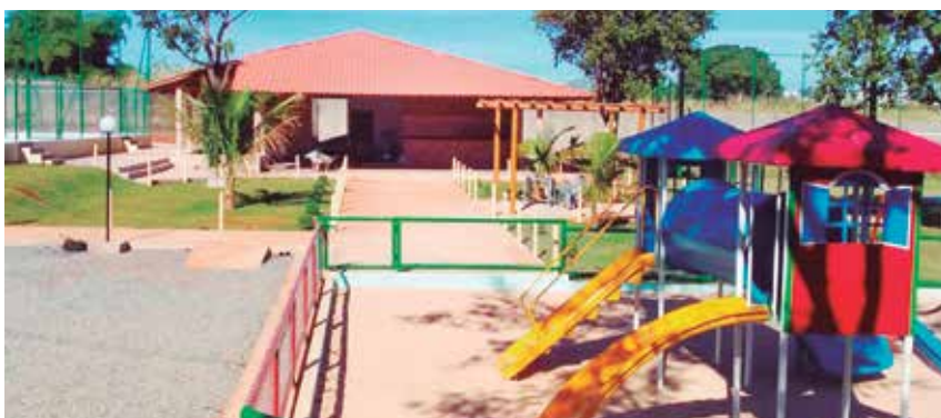
Vista do parque infantil e salão gourmet