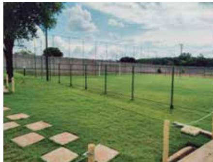
Campo de futebol Society