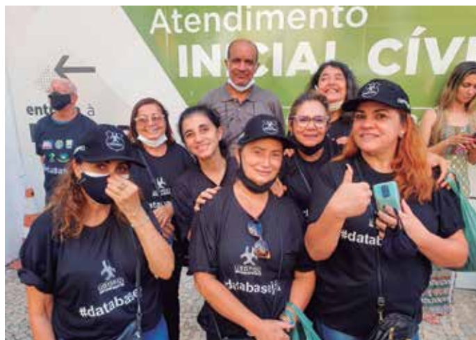
Diretoria da UGOPOCI participaram de manifestação da data-base