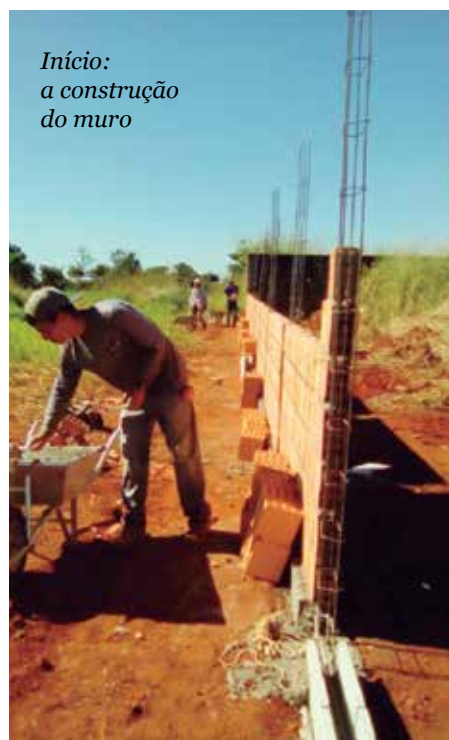
Início: a construção do muro