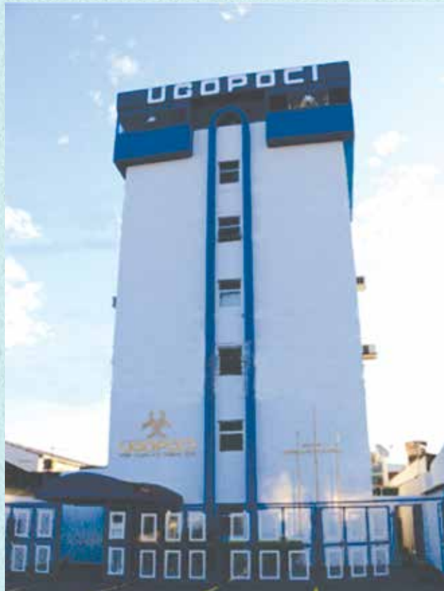
Prédio da UGOPOCI agora conta com isenção do IPTU

ação judicial demandou tempo, mas a UGOPOCI conseguiu sentença favorável de primeiro grau em 2019, decisão que foi confirmada posteriormente pelo Tribunal de Justiça de Goiás. Finalmente, em abril de 2021, a sentença foi transitada em julgado. “Agora, com a certidão reconhecendo todos os dé-