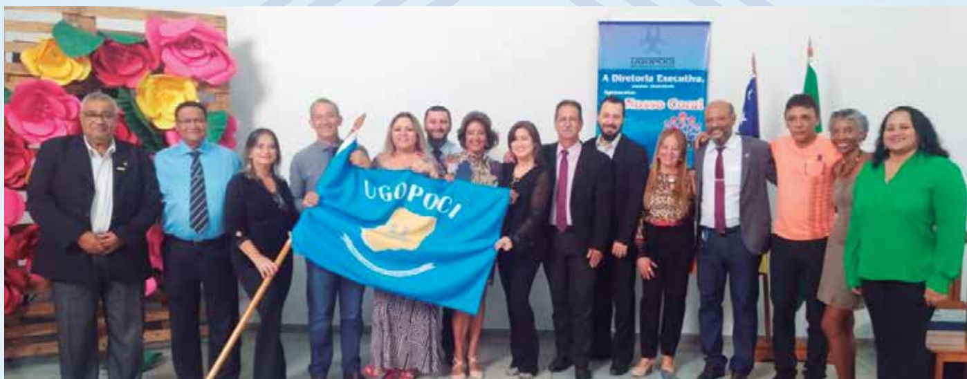
Diretoria UGOPOCI que Queremos, 2019/2022 durante ato de posse

Fica aqui meu agradecimento a todos pela confiança depositada em nossa equipe. Agradeço também aqueles que trabalharam direta ou indiretamente comigo. Só tenho motivos e orgulho de fazer parte desta querida associação chamada UGOPOCI. Que em 2022 possamos alcançar todas as nossas metas. Fiquem todos com Deus!