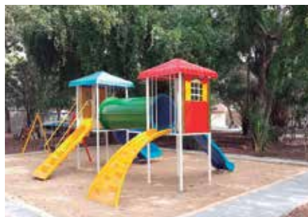
Espaço de lazer para a garotada