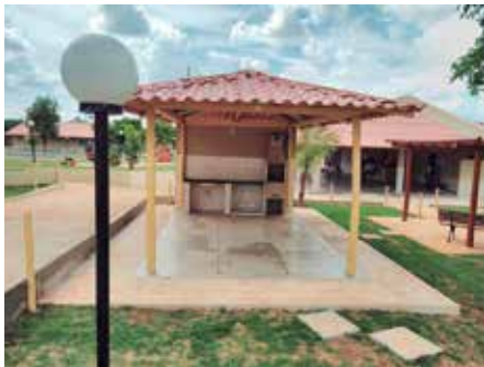
Quiosques para churrascos