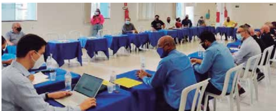
Presidente José Virgílio discute os novos rumos da manifestação em favor da data-base