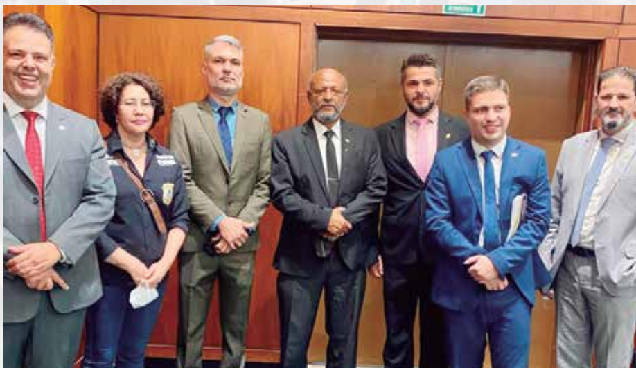
Parte da diretoria da UGOPOCI presente na votação do projeto de lei de interesse dos seus associados

O novo projeto de lei concede aos policiais civis, que ingressaram