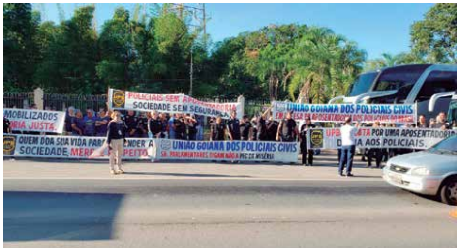
UGOPOCI mobiliza policiais civis goianos contra a reforma da previdência

De acordo com os organizadores, cerca de quatro mil pessoas participaram, incluindo caravanas de vários estados do Brasil. Na ocasião, os manifestantes reclamavam que o Governo Federal tinha optado por definir as regras de aposentadoria e pensão de policiais civis e federais, policiais rodoviários federais, de agentes penitenciários e socioeducativos, guardas municipais e daqueles que desempenham atividades de risco de modo diferente dos policiais militares e bombeiros militares, que seguiriam as regras da reforma das Forças Armadas.