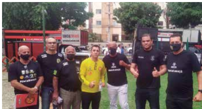
Dirigentes classistas e demais autoridades prestigiam a solenidade