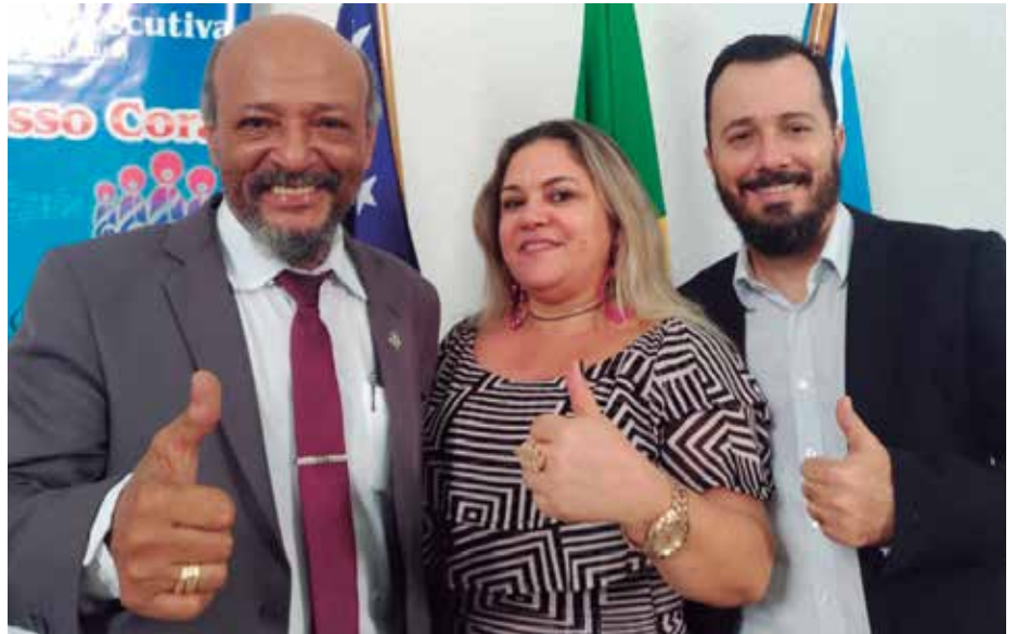
Diretoria apresenta uma retrospectiva de tudo o que foi feito nos últimos 3 anos

Outro fato marcante, durante o atual mandato, que ficará registrado para sempre em nossa memória, foi a descoberta e disseminação da Sars-CoV-2. A Covid-19, que assolou e ainda