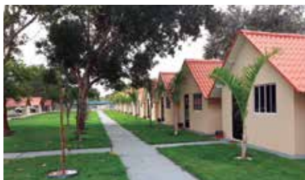
Treze chalés totalmente equipados e disponíveis para os associados (as) mediante reservas