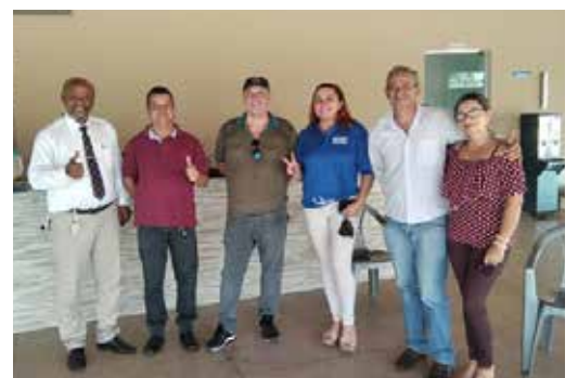
Diretoria e associados visitando o salão de eventos da UGOPOCI