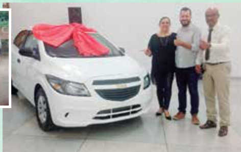
Veículo OKm adquirido pela atual gestão

No ano de 2019, a UGOPOCI viu a necessidade de comprar um novo veículo para atender as demandas da Entidade, uma vez que o carro deixado estava sem condições de uso, com mais de três mil reais em multas e em nome de uma Associação inexistente.