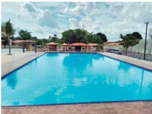
Piscina adulta semi-olímpica