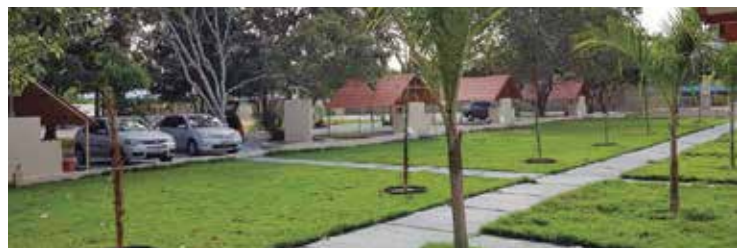
Cinco choupanas com pias e churrasqueiras para quem vai acampar