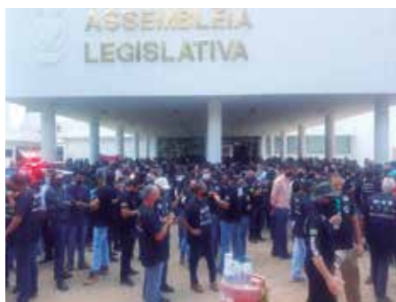
Servidores protestam e cobram a data-base do governo estadual